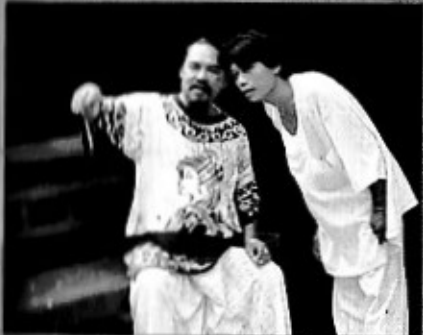
အဘယ်သီချင်း ချမှတ်ခဲ့သော လမ်းကြောင်း