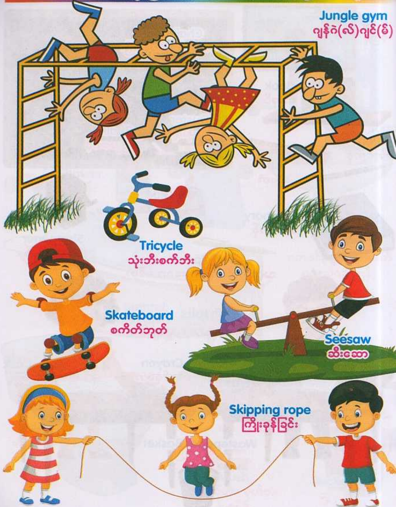
Jungle gym ဂျန်ဂဲ(လ်)ဂျင်(မ်)