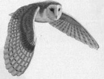
အသံဆိုး၍ ကံဆိုးရ

အော်သံက ဆိုး လင်ကောင်ပိုး နေ့စင်းအခါ ချောင်မှာ တိုး။ ဖိုးချုပ်ခါစ ထွက်လာကာ ကြွက်ငယ် ငှက်ငယ် သူ လိုက်ရွာ။ တစ်ခါ တစ်ခါ အော်ဟစ်သွား အုန်းပင်ထိပ်ဖျား ထန်းထိပ်ဖျား။ ကြားရသူတို့ ကြောက်ကြရာ ငှက်ဆိုးထိုးဟု ဆိုကြပါ။ သူ့ဓမ္မာမှာ ကံခေတ္တ ကြားရသူတို့ ကြောက်ရွံ့ကြ။ သူ့အသံသာ ချီပါက သူ့ရောငါပါ ချစ်မည်ပျီ။ အော် အော် ဆိုးလှ သူ့ကံက။ အသံ ကြမ်းရှု ဖြစ်လို့ပျီ တဲ့။ ။